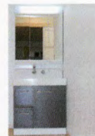
洗面シャブードレッサー